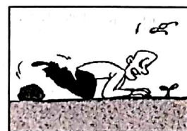
一个快乐的失败者,本身就是另一个胜利者。

17. 餐桌上的一饭一蔬,离不开农民的辛勤耕耘;孩子们的健康成长,离不开教师的谆谆教诲;城市的快速发展,离不开建设者的汗水浇筑……这告诉我们